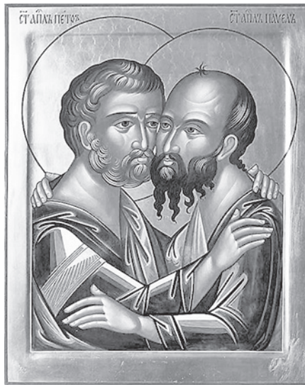
Святые апостолы Петр и Павел. Современная икона.

11 июня — Обретение мощей прп. Иова, в схиме Иисуса, Анзерского (2000 г.). Святителя Луки исповедника, архиеп. Симферопольского († 1961 г.). Икон Божией Матери, именуемых «Споручница грешных» и «Недремлющее Око».